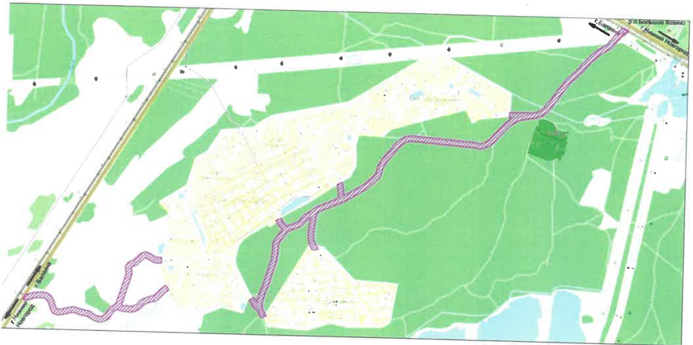
Схема границ разработки инженерных изысканий