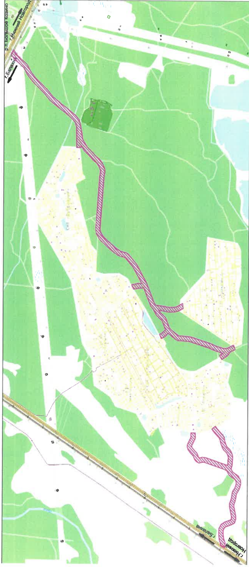
Схема границ разработки проекта межевания территории

Заявитель: Администрация Балахнинского муниципального округа Нижегородской области